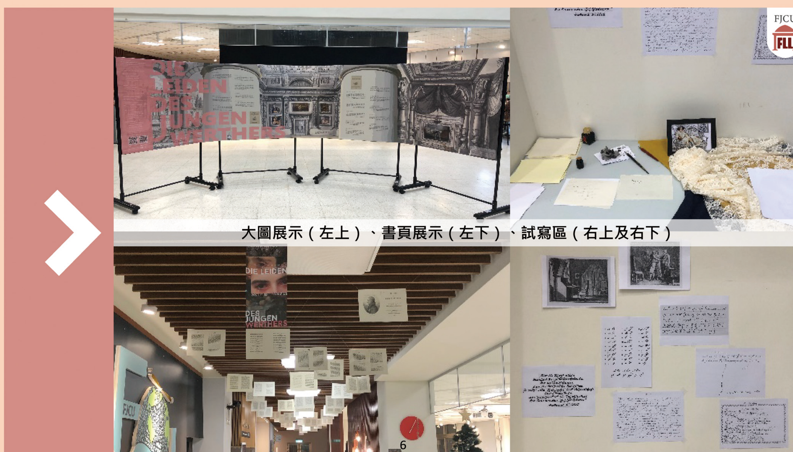
大圖展示 (左上)、書頁展示 (左下)、試寫區 (右上及右下)